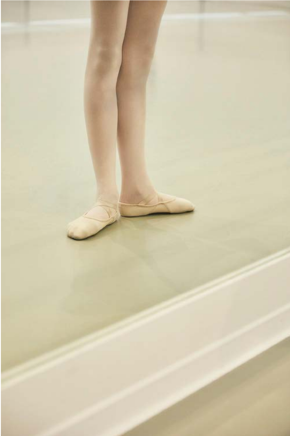
Little Black Bird , impression sur dibond, caisse américaine en chêne massif, 40 x 60 cm