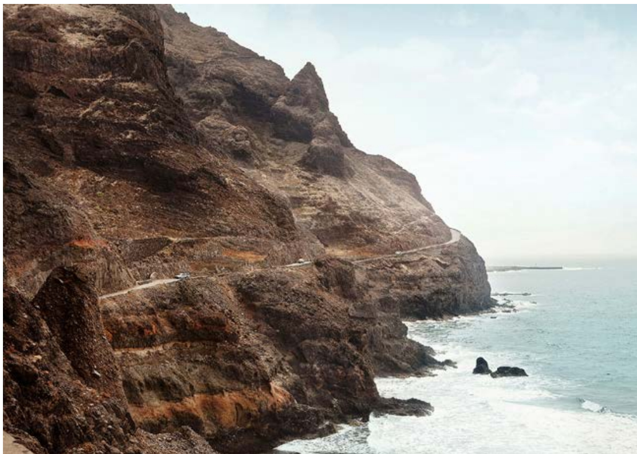
The bends of the road, impression sur dibond, caisse américaine en chêne massif, 90 x 60 cm

© Olivier Metzger/Modds. Courtesy Artsphalte