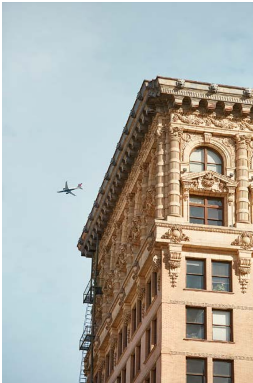
Blue sounds, impression sur dibond, caisse américaine chêne massif, 40 x 60 cm © Olivier Metzger/ Modds. Courtesy Artsphalte