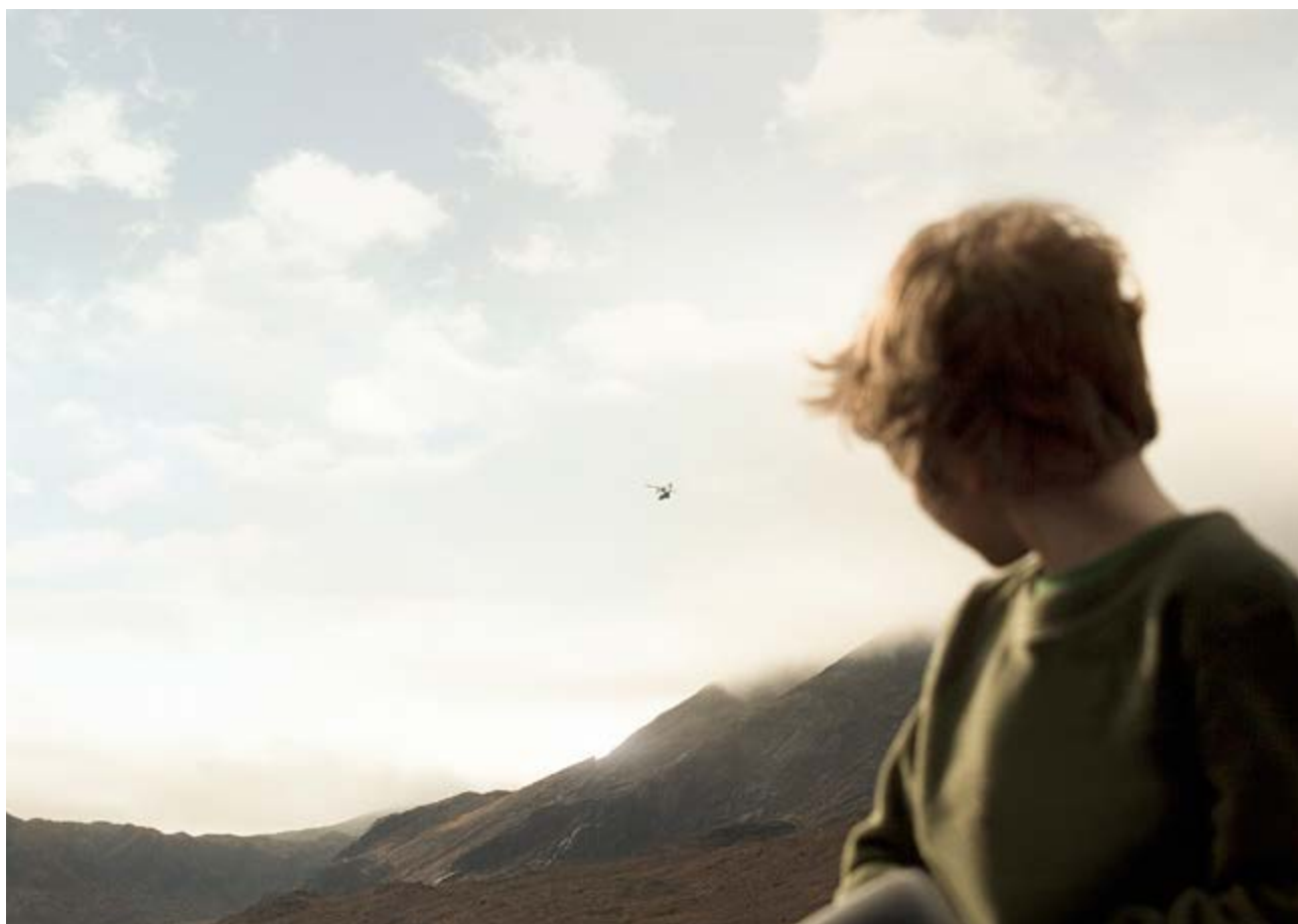
Highlander , impression sur dibond, caisse américaine en chêne massif, 90 x 60 cm